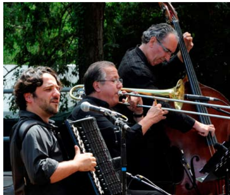
Le Trio Barollo