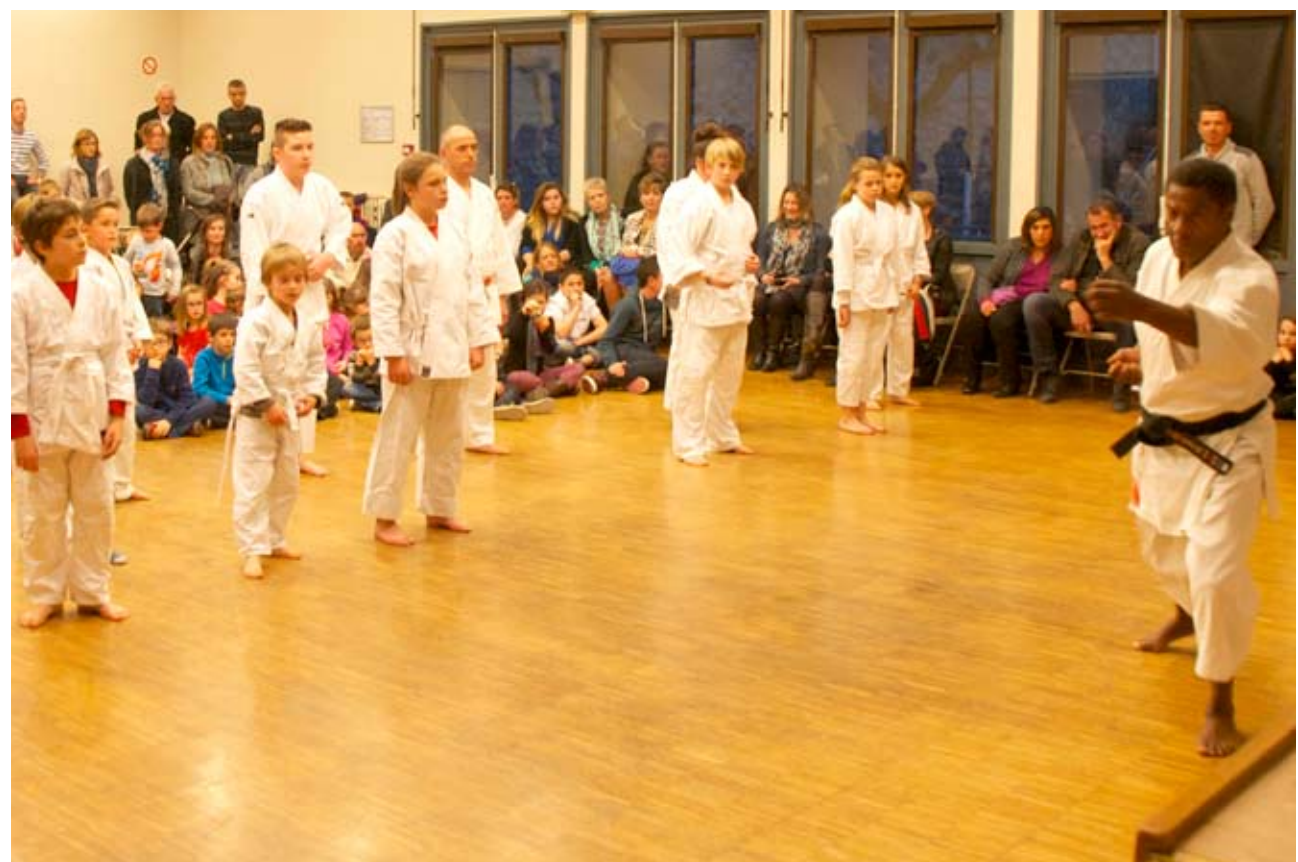
Activités au foyer rural