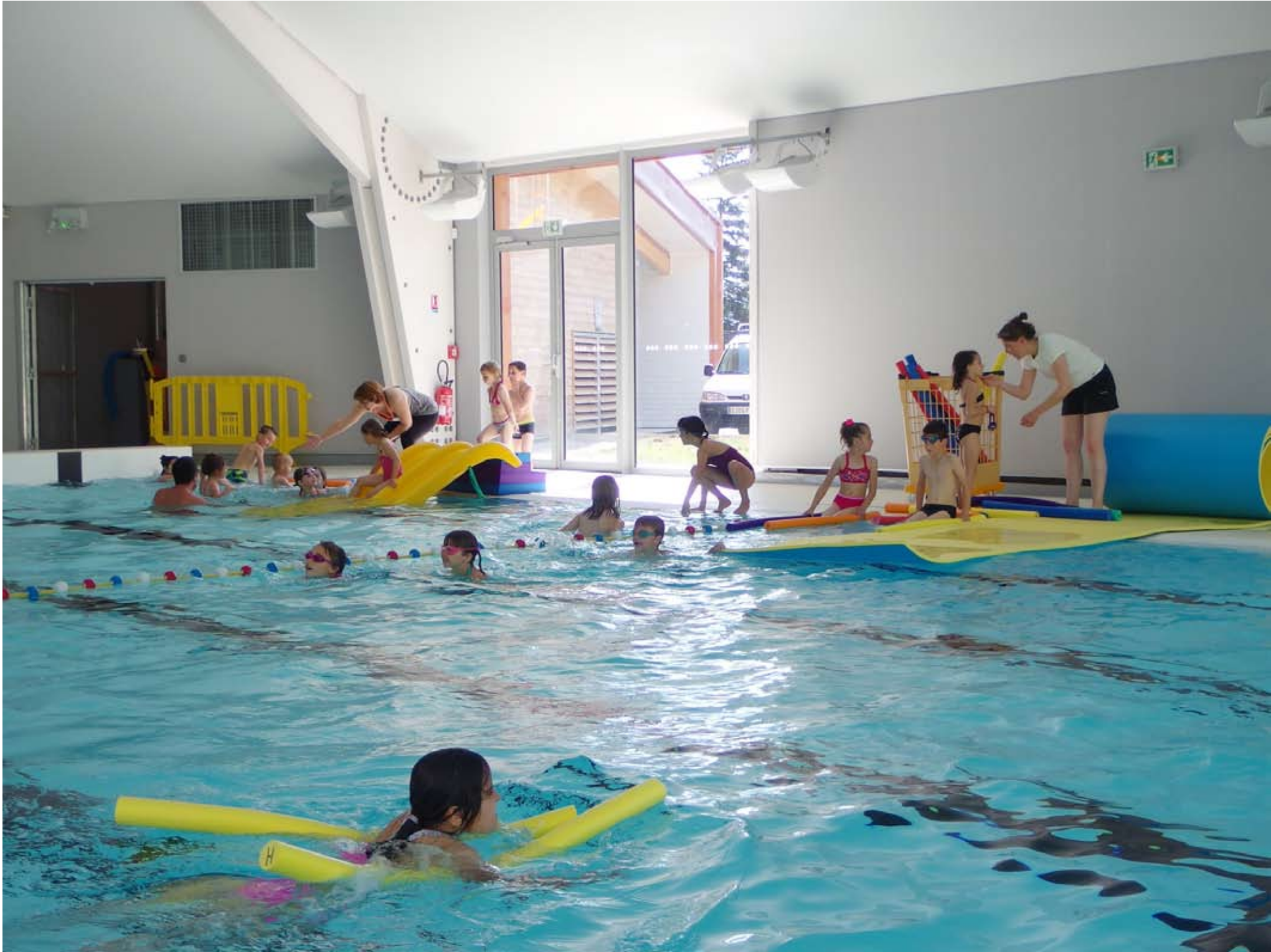
Les scolaires à l'Hippocampe