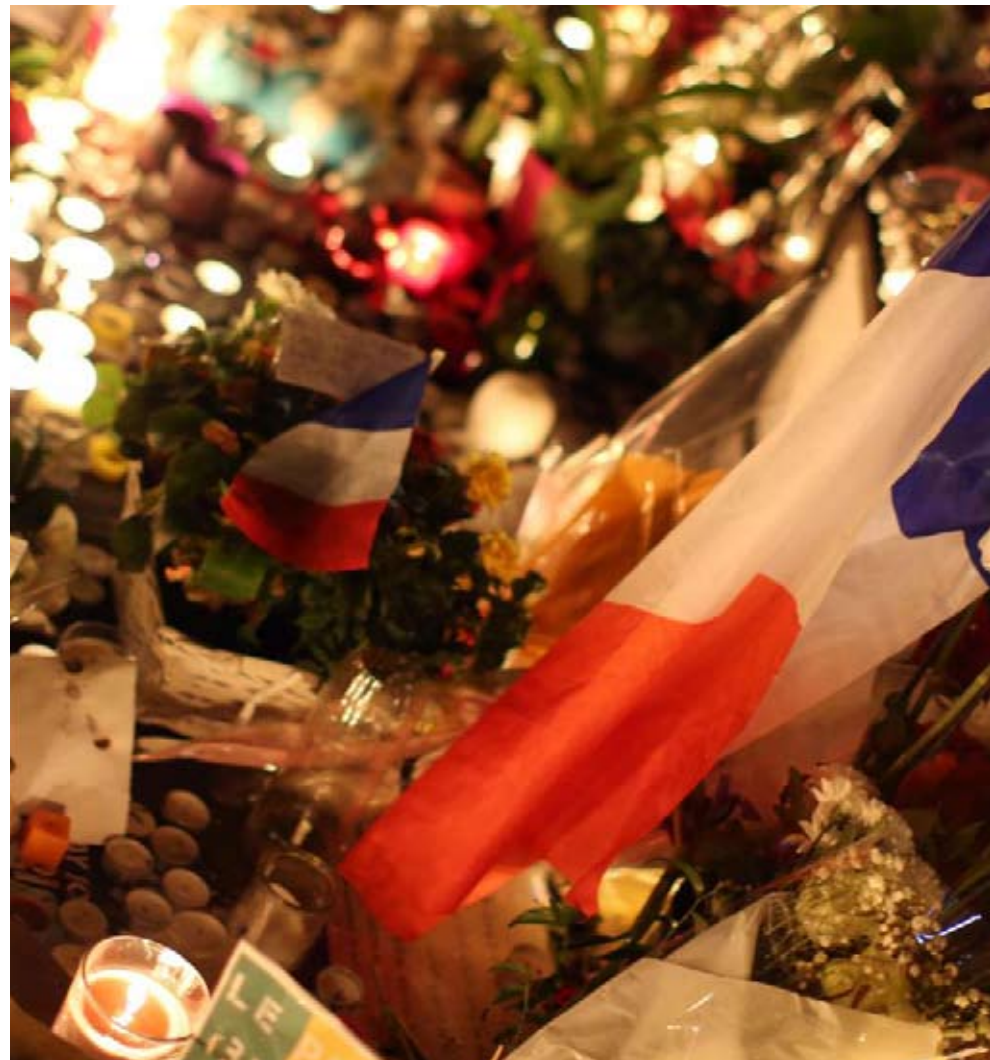
L'émotion après les attentats à Paris le 13 novembre

Dans un contexte difficile, nous démontrons notre volonté d'aller de l'avant en continuant d'investir pour entretenir et valoriser notre patrimoine, et aussi pour créer de l'emploi et conforter la vie économique, commerciale et sociale de notre village.