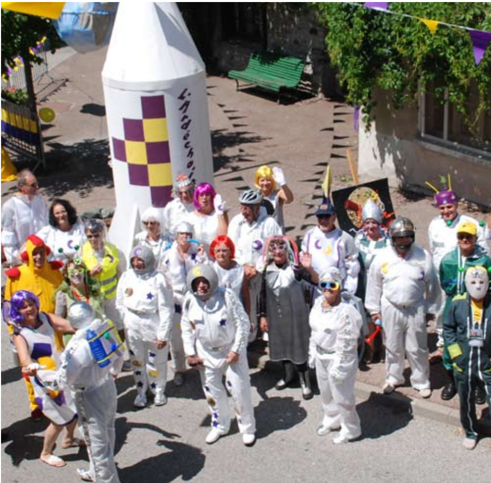
L'année 2015 - De gauche à droite et de haut en bas : L'ardéchoise / Le carnaval / La vogue